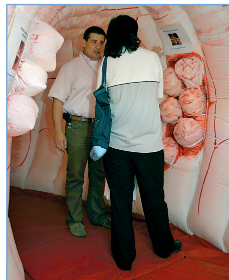
S maketou obrieho nafukovacieho čreva OZ europacolon prešlo celé Slovensko

„Vieme, že až 90 % tejto rakoviny sa dá vyliečiť ak sa odhalí včas. No jej systémove vyhladávanie u najohrozenejších občanov nad 50 rokov – takzvaný skríning sa na Slovensku ukončil v roku 2007 a pretrváva iba málo efektívny oportúnny typ skríningu.“